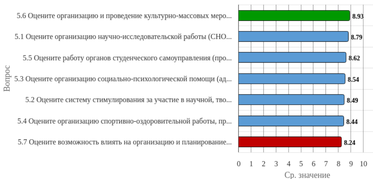
Рисунок 2.5.1 - Распределение показателей уровня удовлетворенности всех респондентов по блоку вопросов «Удовлетворенность организацией внеучебной деятельности»

Индекс удовлетворенности по блоку вопросов «Удовлетворенность организацией внеучебной деятельности» равен 8.58.